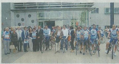
La partenza della Granfondo dall'ospedale Giovanni XXIII